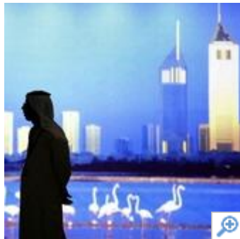
Etlche Anleger haben sich von den arabischen Banken abgewendet.

Auch Arabiens Banken leiden in der Krise unter Kapitalflucht und faulen Krediten. Doch am Golf flammt leichte Hoffnung auf: Die massiven staatlichen Infrastrukturinvestitionen könnten die Bankbilanzen retten. Erste Institute geben bereits Entwarnung.